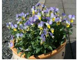
Sumarblómin birtast úti

Á markaðstorgi verður til sölu grænmeti, blóm og trjáplöntur. Okkar landsfræga hnúðkál er tilbúið í sölu, þeir sem hafa hug á að komast yfir það ættu að mæta snemma.