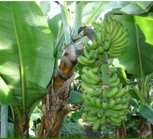
Bananarnir proskast inni